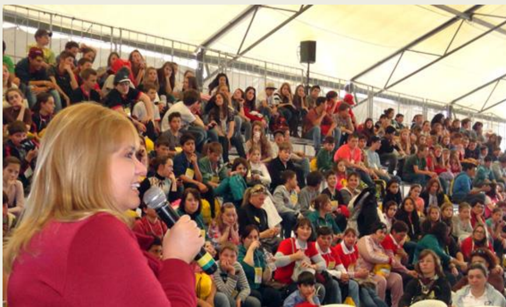
Jornada Literária de Passo Fundo (RS)